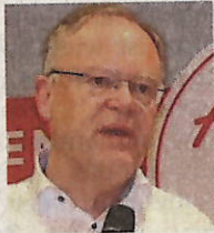
Stephan Weil Ministerpräsident

Der BBS-II-Neubau an der Esterholzer Straße – Spatenstich war Mitte März – soll Ende des Jahres im Rohbau stehen. Im Anschluss ist die Sanierung des Bestandsgebäudes geplant. Der Landkreis investiert alleine hier rund 18,2 Millionen Euro, der BBS-Campus insgesamt soll 107 Millionen Euro kosten. Der BBS-I-Standort Scharnhorststraße wird aufgegeben.